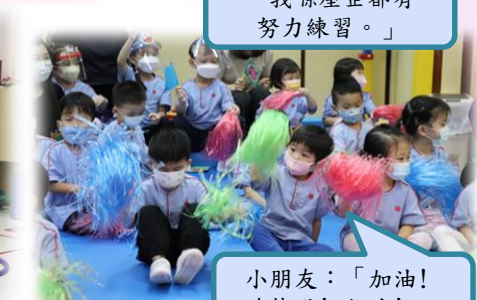
小朋友：「加油! 跑快點! 加油!」

於運動會中，幼兒互相鼓勵、打氣、支持和欣賞，他們不只考慮自己能否成功，也希望班中的其他幼兒能完成項目，獲得好成績，並一起分享喜悅等等，這都有助他們建立正向品格，學會感恩、仁慈及增進社交技巧。