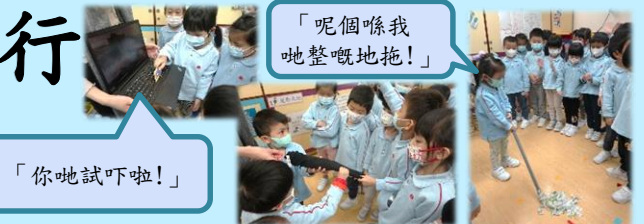
「呢個喺我哋整嘅地拖！」