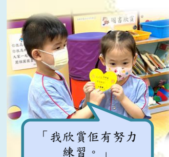
「我欣賞佢有努力練習。」

於運動會中，幼兒互相鼓勵、打氣、支持和欣賞，他們不只考慮自己能否成功，也希望班中的其他幼兒能完成項目，獲得好成績，並一起分享喜悅等等，這都有助他們建立正向品格，學會感恩、仁慈及增進社交技巧。