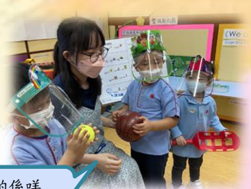
「呢啲係咩運動用品?」

幼兒設計及舉辦一場運動會，並進行賽前練習。透過運動員紀錄冊，讓家長認識正向教育，學會正向讚賞鼓勵幼兒，培養自身及孩子的成長性思維，藉此讓他們明白成功是經過努力的練習和堅持，不怕失敗，才可以獲得成果。