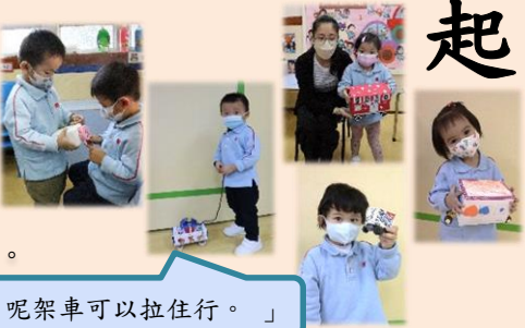
「呢架車可以拉住行。」

老師與幼兒進行一連串的探索活動，例如討論製作玩具車需要的材料，並邀請家長與幼兒一起製作一輛玩具車。