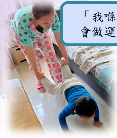
「我哋屋企都會做運動。」