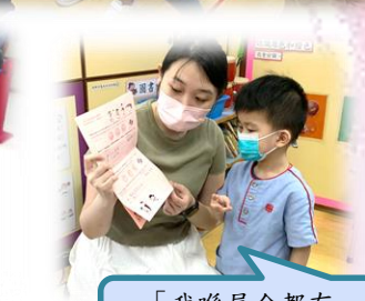
「我哋屋企都有努力練習。」