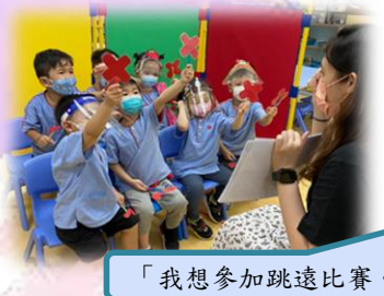
「我想參加跳遠比賽。」