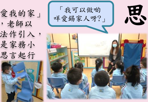
「我可以做啲咩愛錫家人呀？」

於前主題「我愛我的家」中認識了家務，老師以關懷家人的方法作引入，展開了以「我是家務小幫手」為題的思言起行設計活動。