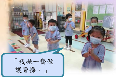
「我哋一齊做護脊操。」

於「推動正向教育 - 邁向全人發展」計劃中，「學與教」也是本校推行正向教育的大方向，希望從小培育幼兒對學習和人生持正向態度。幼兒班進行以「運動小健將」的思言起行設計活動，當中幼兒都不停的發問及積極參與不同運動，展現了他們的好奇心及堅毅等正向思維。