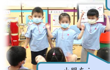
小朋友：「大家齊來做運動。」

幼兒設計及舉辦一場運動會，並進行賽前練習。透過運動員紀錄冊，讓家長認識正向教育，學會正向讚賞鼓勵幼兒，培養自身及孩子的成長性思維，藉此讓他們明白成功是經過努力的練習和堅持，不怕失敗，才可以獲得成果。