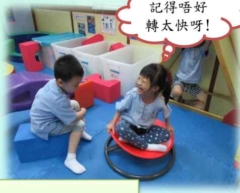
記得唔好轉太快呀!