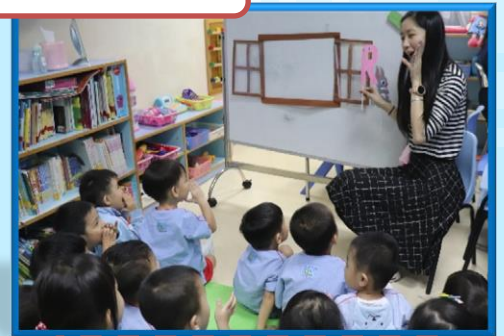
Song and Rhymes 兒歌及童謠