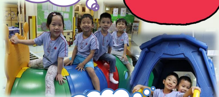
要一個跟一個排隊!

除了恆常的大肌肉技巧訓練，兒童亦會與同儕利用不同的大肌肉設施進行活動，如：利用積木製作樓梯，從而建立友伴關係。