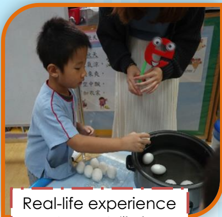
Real-life experience 生活經驗學習