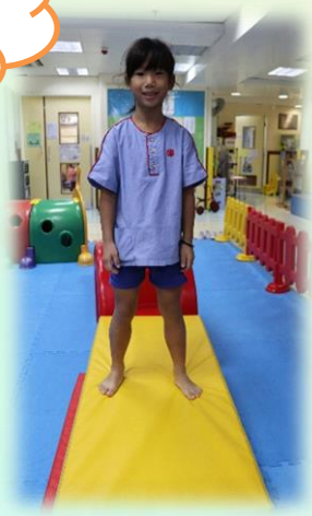
每一次最多只可以有4個小朋友玩毛毛蟲!