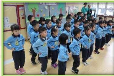
金章和銀章快樂小蜜蜂正進行精彩表演。