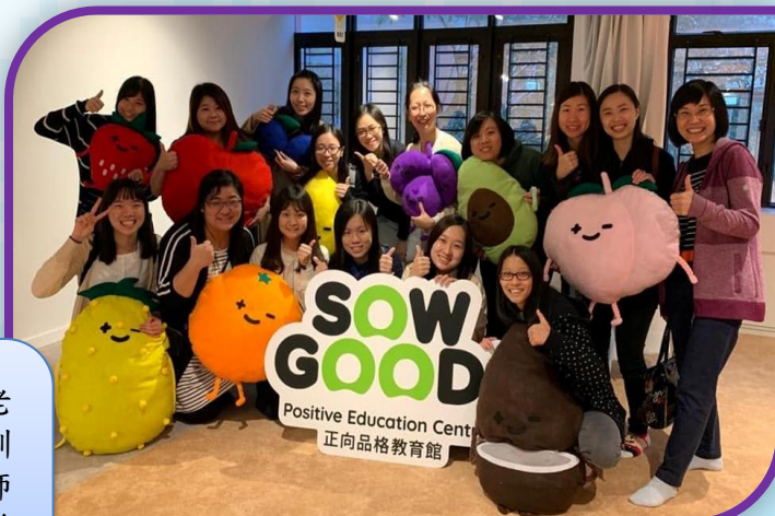
參觀SOWGOOD! 正向品格教育館