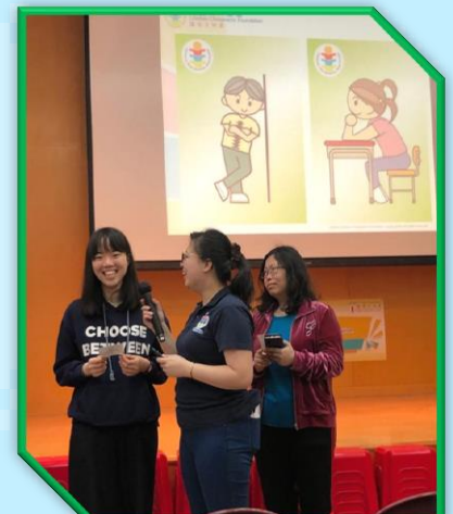
護脊校園教師工作坊