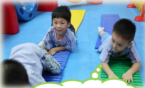
我哋扮緊毛毛蟲！好好玩啊！

兒童在大肌肉室運用已學的技巧進行不同的體能遊戲，如：與同伴玩拋接球、投籃遊戲等，藉以提升其身體不同部份的協調能力。