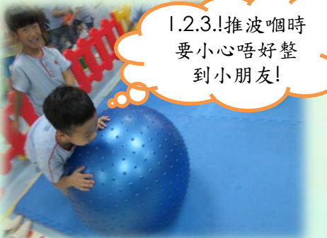
1.2.3.!推波嗰時要小心唔好整到小朋友!